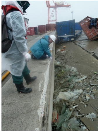
写真-12 約 1.4m の段差

塩釜港湾・空港整備事務所に設置してある港湾強震観測網の強震計は 1.8m 程度の津波浸水が確認されたが，メモリーカードを回収し，解析中である．