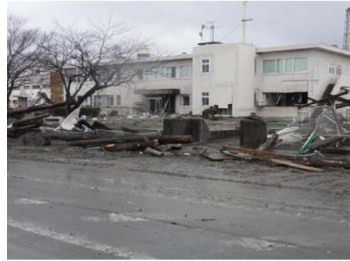
写真-2 大手埠頭背後の合同庁舎