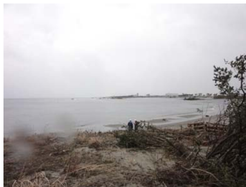
写真-11 蒲生干潟前面の海浜