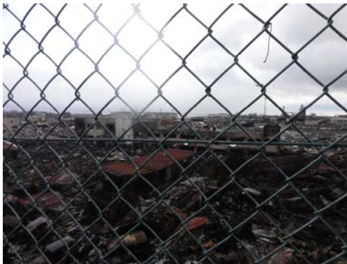
写真-3 日本製紙敷地の高台から海岸にかけての様子