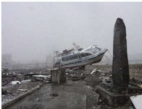
写真-13 西埠頭観光棧橋周辺の様子

調査地点周辺の建物に大きな損傷は見られなかったものの，船舶やトラック，車などが多数漂流していた．