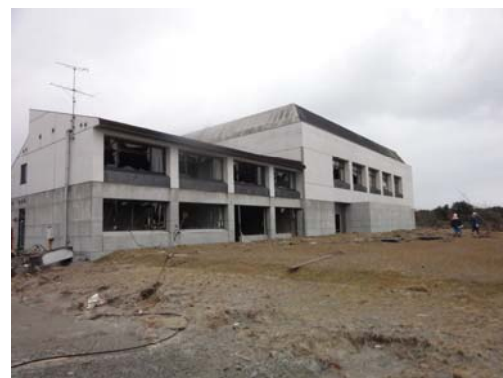
写真-10 高砂埠頭背後の体育館