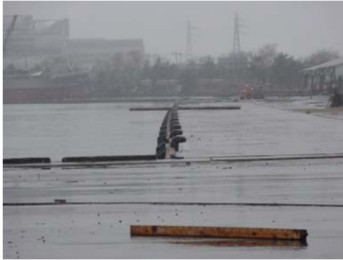
写真-1 大手埠頭西側の様子

石巻港の港外北側では、がれきのため海岸には到達できなかったため津波高は測定できなかったが、遠方高台からの目視では、離岸堤群の内の2基は少なくとも大きく被災しているようには見えなかった（写真-4）。