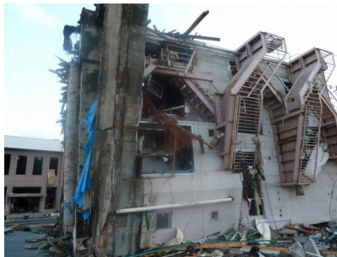
写真-19 転倒した4階建ビル。左端に杭がぶら下がっている

漁港岸壁から約60m内陸部に建設されていた4階建ビルが転倒し約23m陸側に移動している。ビルの基礎杭は、概ね杭頭部分で破断しているが、1本は杭頭部分の鉄筋でぶら下がっている。地震により液状化現象が発生し緩んだ地盤になった後に、津波が作用したため引き抜けが生じた地震と津波の複合被災事例と考えられる。(写真-19) 防潮堤・水門・陸閘などの施設設計の際に、基礎の耐震性を考慮する必要性が示唆された。