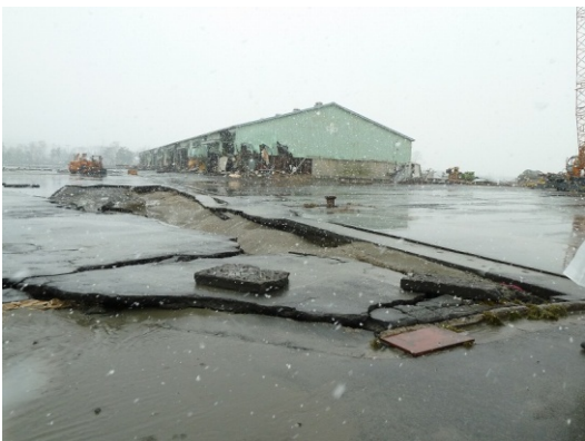
写真-5 荷さばきヤードの洗掘による沈下・陥没

津波による瓦礫のため限られた場所のみの調査であったが、大手埠頭（矢板式・栈橋式岸壁）の岸壁本体に甚大な損傷は認められず、荷さばきヤードに沈下・陥没（写真-5）が確認された。大規模な液状化の発生は無かったものと考えられるが、一部で液状化により舗装に損傷が発生し、次に津波が作用し洗掘されたことによる沈下・陥没と考えられる。穀物用のアンローダー（荷揚げ用機械）が3機（免震機構を有さない）設置されていたが、1機がレールからの脱輪（写真-6）、残り2機は岸壁上に存在せず、車輪の一部のみが残留していた。地震動により海中に倒壊したものと考えられ、対策としてはアンローダーへの免震機構導入の技術開発が有効である。