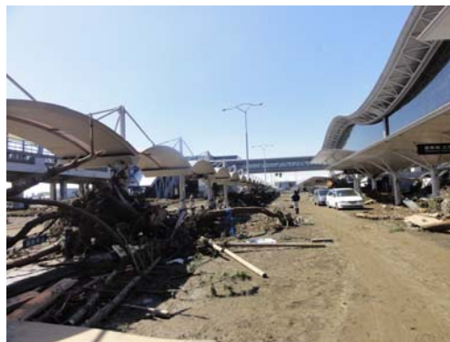
写真-15 ターミナル外部の様子