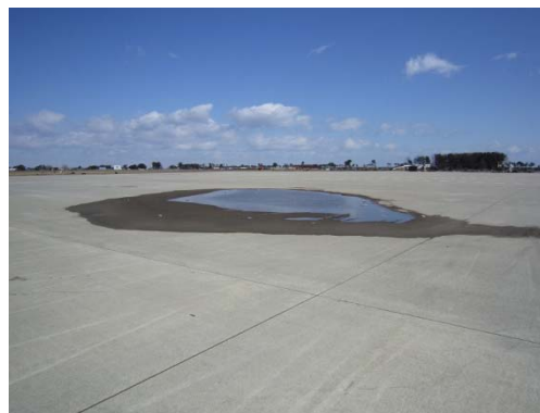
写真-17 液状化による駐機場舗装の沈下