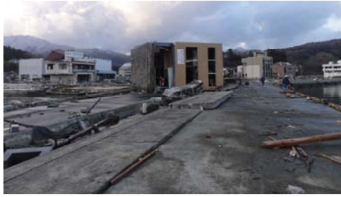
写真-18 岸壁近傍で倒壊した鉄骨造の建物