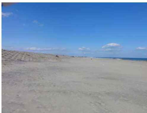
写真-22 護岸前面の砂浜