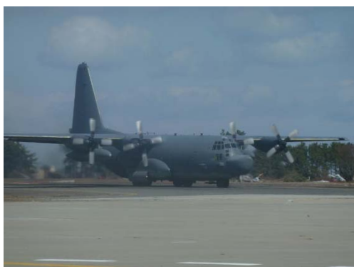
写真-16 着陸した大型輸送機

空港の主要施設である滑走路については、液状化対策を実施していたことから、一部軽微なクラックが発生しているが当面の支援輸送機の運航が可能な状態であることを確認し、大型貨物機 (写真-16) による物資輸送が開始された。空港において液状化対策の効果が確認できた初めての事例となった。一方海岸線に近い部分に位置する場周道路・駐機場で液状化 (写真-17) の発生による損傷・沈下の発生が確認されたことから、詳細な調査を実施すべく調査団を平成 23 年 3 月 21 日に派遣した。また、緑地帯に帯水が見られることから、止水壁の構築・ポンプアップなどの対策を実施する際には、舗装構造への影響を評価した検討および継続的な観測が必要と考えられる。