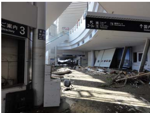
写真-14 ターミナル内部の様子