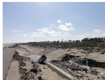
写真-21 護岸とその背後の洗掘（南側）