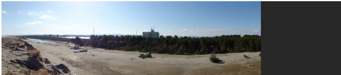
写真-24 人工砂丘背後の松林の様子