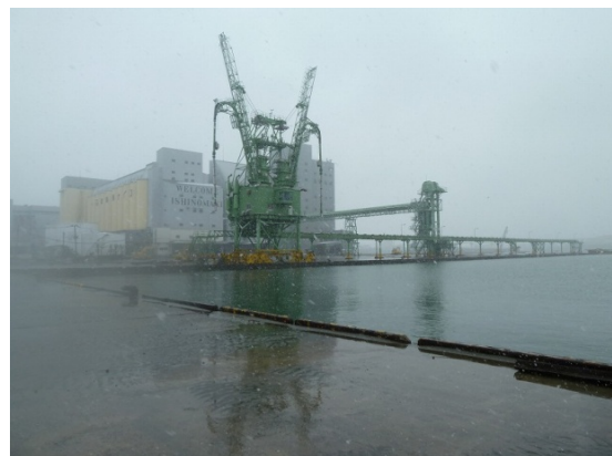
写真-6 穀物用アンローダー