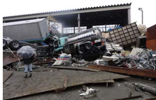
写真-8 雷神埠頭背後の建物