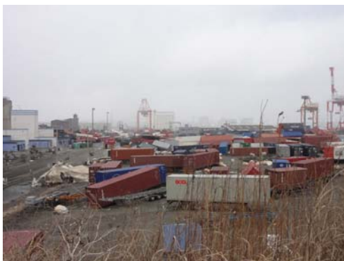
写真-9 高砂埠頭におけるコンテナ散乱の様子