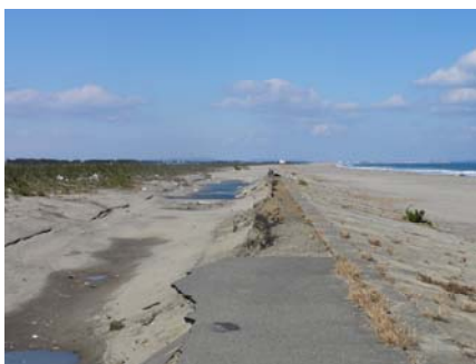
写真-20 護岸とその背後の洗掘（北側）

砂浜は，護岸前面まで一様勾配斜面となっていた（写真-22）。通常の砂浜は，汀線から風波の遡上地点までは一様勾配斜面であり，それより陸側はしばらく水平となっていることが多い。護岸を越える津波の通過によって，そのような地形がならされて一様勾配斜面になったと考えられる。ただし，津波前の地形は不明であるものの，護岸前面での土砂移動量や護岸を越えての土砂移動量は小さいと考えられる。