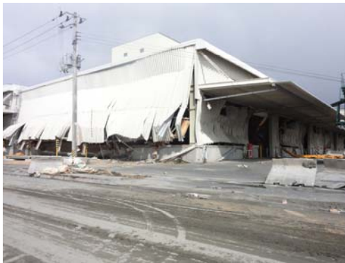
写真-7 中野埠頭の倉庫