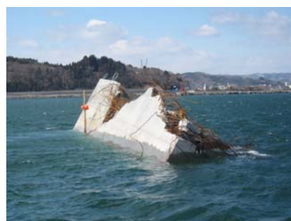
写真2 被災した仮置きケーソン