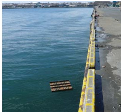
写真 6 八太郎地区 P 岸壁の法線