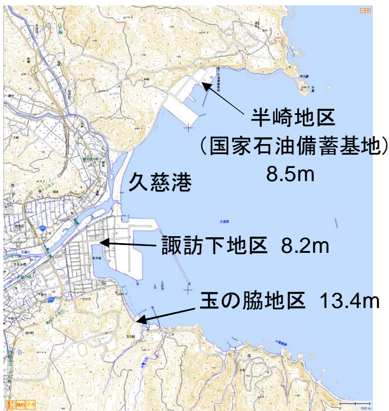
図2 久慈港の津波痕跡高