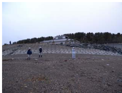
写真 4 階上町大蛇地区（写真上にある建物内で水跡を測量）

また、港湾内の 8 地点で微動観測を実施した。その結果、強震観測点から北にある地域ではピーク周波数が低周波側に移動し周期の長い地震波が作用し易い傾向にあること、逆に南にある地域ではピーク周波数が高周波側に移動して周期の短い地震波が作用し易くなることが推定された。