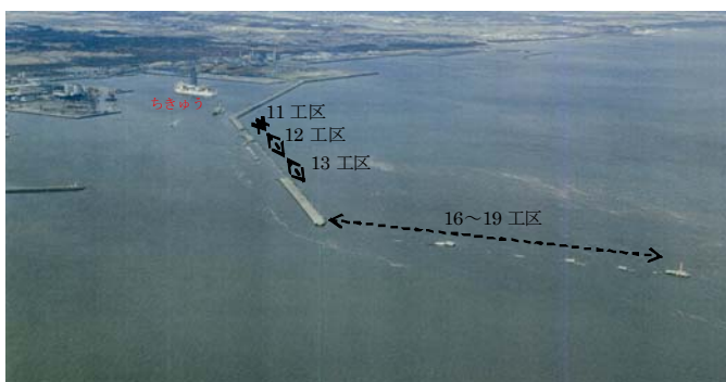
写真1 八戸港北防波堤

津波による防波堤の損傷が認められた(写真1)。総延長3500mの北防波堤のうち1870mが被災し、16~19工区は堤頭函のみを残してそれ以外の多くは消波ブロックおよびケーソンが海中に水没した。一方11~13工区でも移動および水没したが、多くのケーソンはその一部を海上見せていた。さらに、防波堤開口部では津波の速い流れによると考えられる洗掘が生じており、洗掘深は10mに達した。さらにポートアイランド