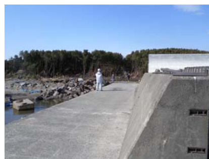
写真3 市川地区の防潮堤と松林

市川地区の防潮堤およびその背後の松林の背後にある住宅地(写真3に写る松林の背後にある住宅地)では、1階部分が水没するような浸水被害が発生しており、家屋の外壁に残った水跡を測量した結果、浸水高6.0m(浸水深3.2m)であった。この地点については、津波の侵入経路を今後詳細に調査する必要があるが、防潮堤や松林がなければ被害は一層大きくなっていったと考えられる。