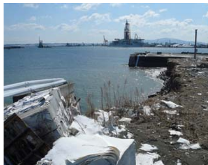
写真 7 取付護岸ブロックの被災