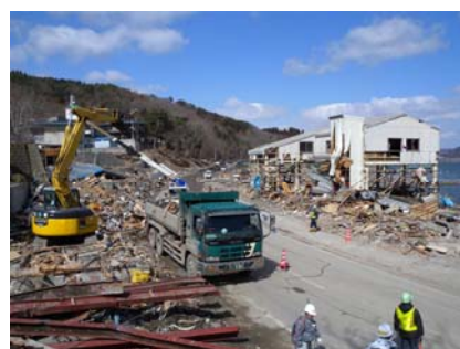
写真3 被災した玉の脇地区