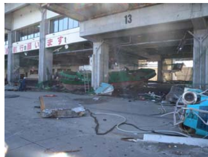
写真4 諏訪下地区の漁協

諏訪下地区栈橋（-7.5m）では渡版の大部分が津波により飛ばされていた。落下した渡版の影響で、鋼管杭の防食工（モルタル被覆+FRPカバー、図1）が多数（確認できたもので11本）損傷し、鋼管杭表面が露出している杭もあり（写真6）、これらについては早期の補修が必要である。