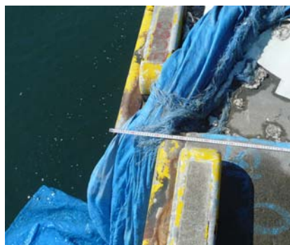
写真 5 八太郎地区 P 岸壁