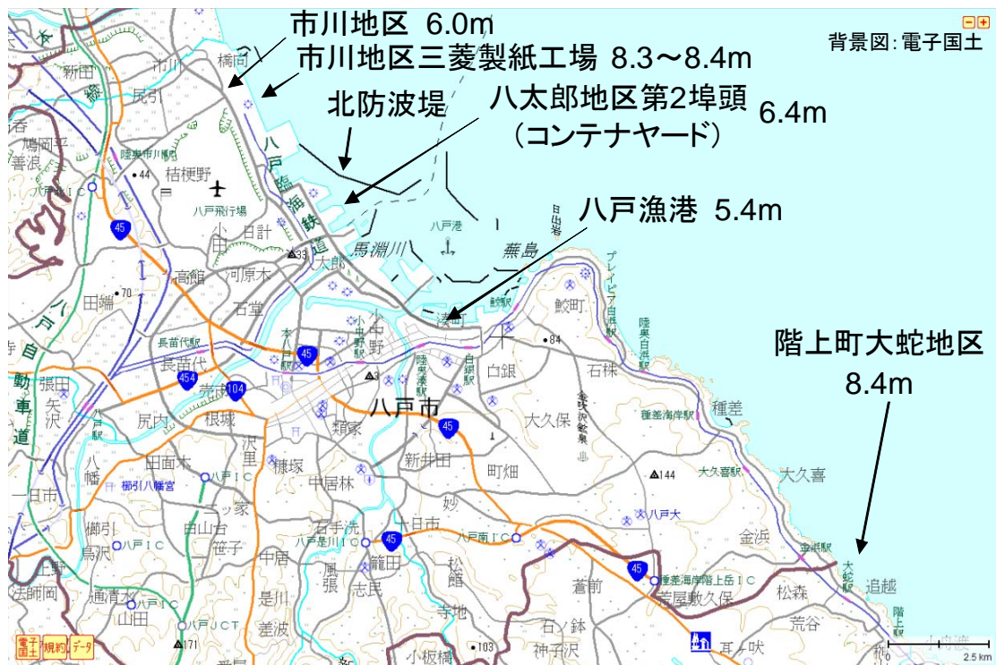
図1 八戸港の津波痕跡高