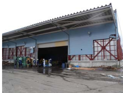
写真2 コンテナヤードの倉庫

八戸港の防波堤内にある八太郎地区第2埠頭(コンテナヤード)では、倉庫(写真2)の内壁に残る水跡の高さを測量し浸水高6.4m(浸水深2.9m)を得た。八戸漁港では建物内に残る水跡を測量し浸水高5.4m(浸水深2.5m)であった。