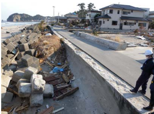
図-19 流失を免れた家屋、その前面の護岸と海岸

院職員から聞いた浸水深あたりを探して見つけた入口内側にあるガラス扉に残った水跡を測量した。