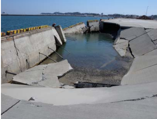
図-5 第1埠頭における物揚場の沈下

ある北防波堤および南防波堤にはほとんど被災は認められなかった。これは、沖防波堤による津波低減効果があったためと現段階では推察される。また、沖防波堤背後の航路や泊地などにおいて、津波による大規模な洗掘が生じていた。