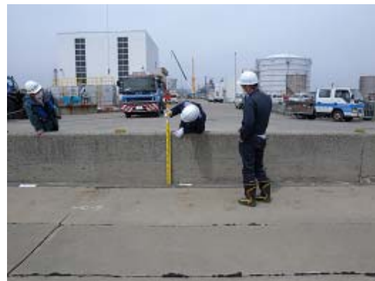
図-15 4号埠頭の高さ0.84mの胸壁、ポンプ場およびタンク