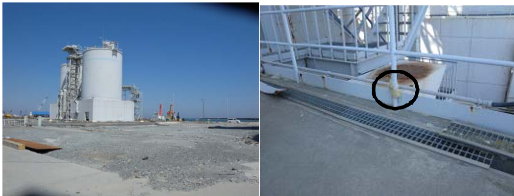
図-2 第1埠頭におけるサイロ（左）と津波痕跡（右）