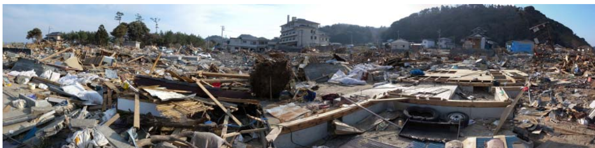
図-20 兎渡路における家屋等の流失

津波痕跡高を測量した木造家屋の隣は完全に流失していた。さらに、この木造家屋や独立行政法人国立病院機構いわき病院から北へ 200m 程度離れた平地部では、図-20 に示すように居住地域が壊滅していた。さらに、流失被害を受けた建物があったと思われる所では、図-19 に示すように護岸のパラペット部が被災していることが多く、前面海域の水深変化に伴う局所的な津波の集中があった可能性がある。