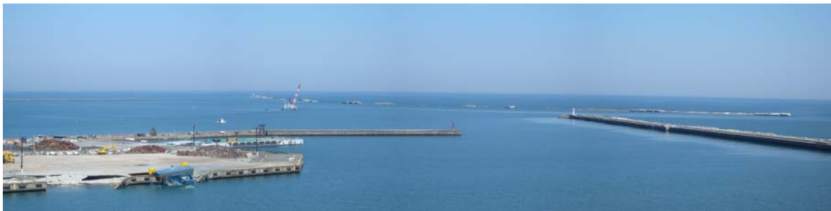
図-8 沖防波堤の被災状況