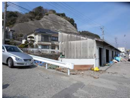
図-18 中之作漁港における被害の少なかった地域