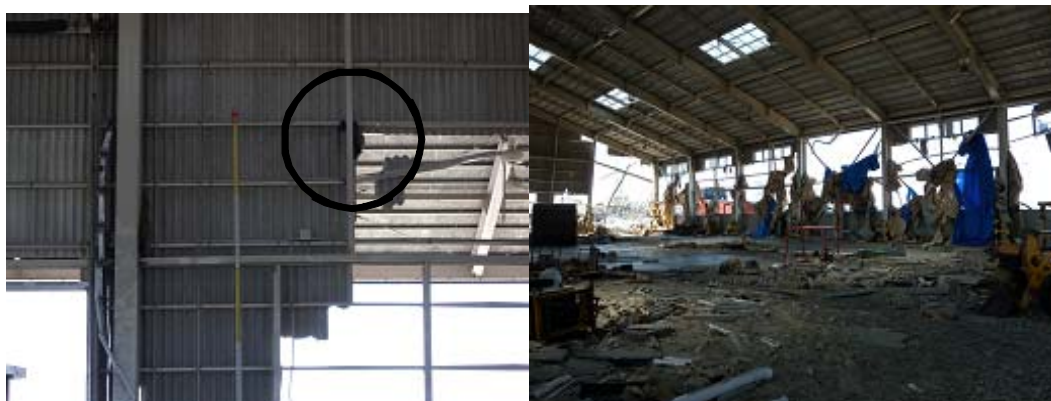
図-3 第2埠頭における津波痕跡（左）および壁の破損状況（右）