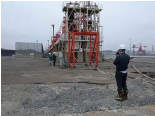
図-16 7号埠頭先端の機械類