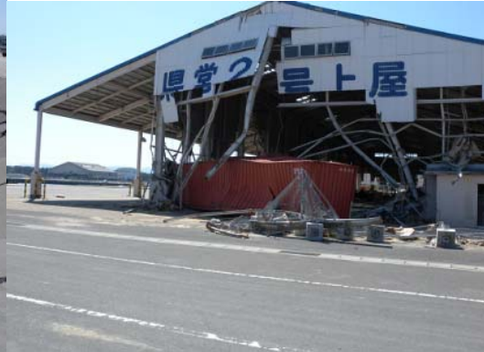
図-6 上屋に衝突したコンテナ