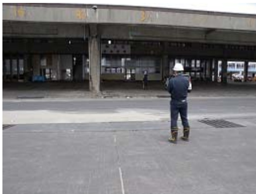
図-14 漁港区魚市場の建物

沖防波堤、西防波堤（第一）および西防波堤(第二)には、津波による被災はほとんど見られなかった。なお、1号埠頭先端の両角部の海底において、津波による5m程度の局所的な洗掘が生じていた。また、港内の泊地においても、場所によっては最大で8m程度の洗掘が見られた。