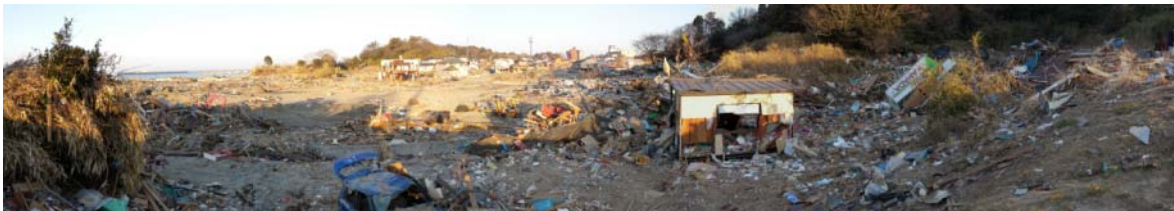
図-7 原釜尾浜海水浴場奥の遡上限界から海側の被災状況