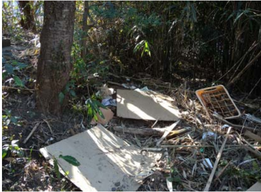
図-9 神社参道脇の漂流物