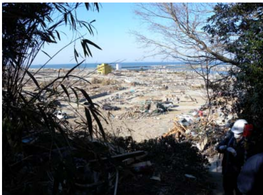
図-11 遡上限界地点から見た街の被災状況

図-11 は遡上限界地点から見た漁港背後の街の被災状況である。黄色の鉄筋コンクリート造の3階建ての家屋が残っており、この屋上では窓ガラスが割れ、砂も残っていたことから津波の打ち上げ高はこの建物を越えたと思われる。また、遡上限界周辺の高台には、図-12 に示すように漁船が数隻打ち上がっていた。