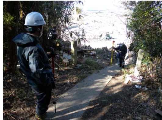
図-10 遡上限界地点から見た街の被災状況