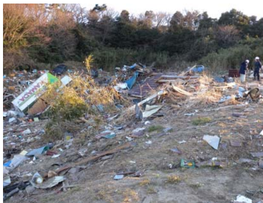
図-4 原釜尾浜海水浴場奥の津波遡上限界