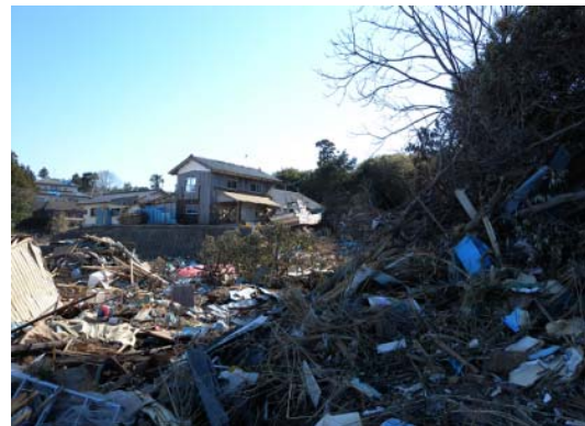
図-12 遡上限界地点周囲に打ち上がった漁船