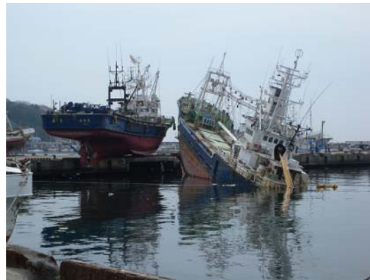
図-17 漁港区に打ち上がった漁船